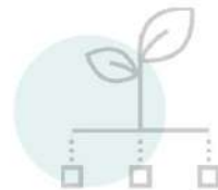
Estructura de la Jornada

El desarrollo de todo tipo proyecto con una misión, visión y valores que resulte competitivamente sostenible, requiere de la correspondiente sensibilización y educación previa y continua, necesaria para que la aplicación de las acciones que se deriven de dicha implementación sea eficiente y eficaz. Y, asimismo, será conveniente seguir de cerca todos los procesos y mejorarlos.