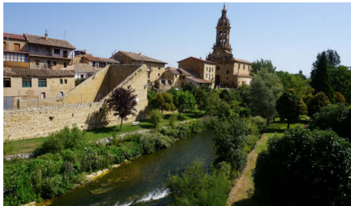
Cauce del río Tirón, a su paso por Cuzcurrita, una zona fluvial junto a la iglesia de San Miguel.

De la tierra al cielo hay un paso, o más bien un paseo por las altu-