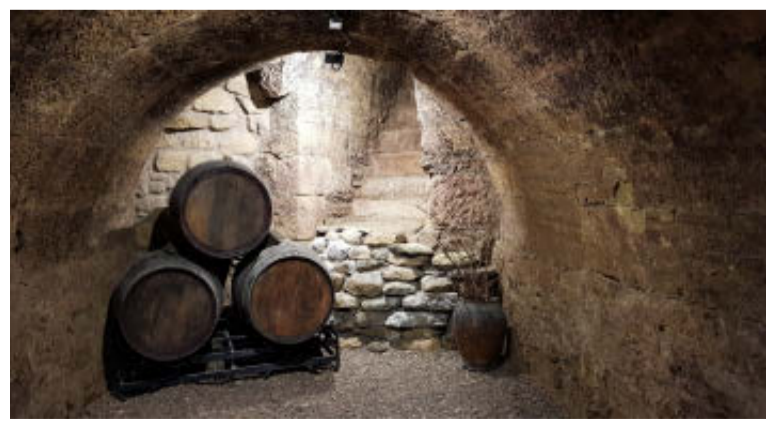
La cultura del vino y sus bodegas, un reclamo turístico. / CARMEN BENGOCHEA ESCALONA