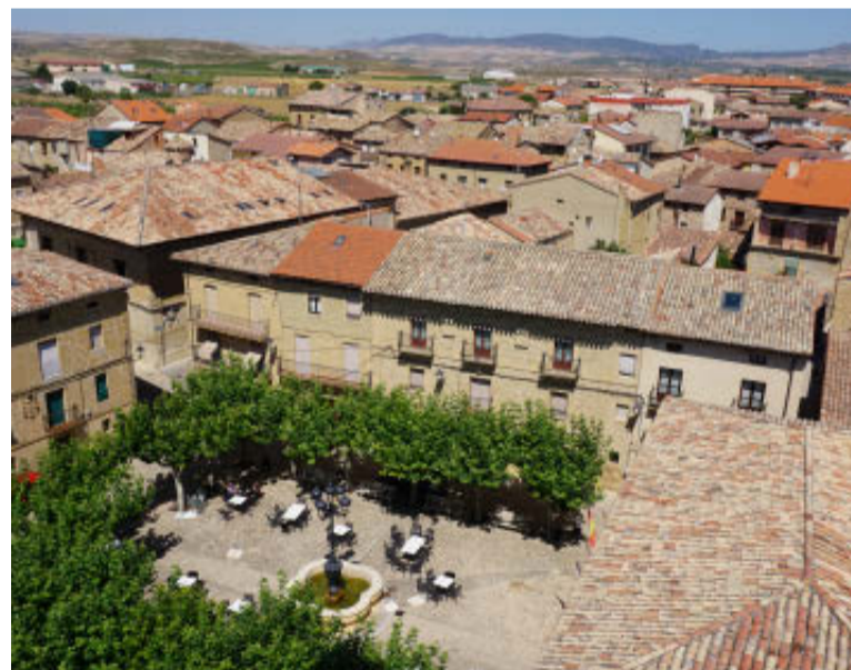
Vista general del centro de Cuzcurrita. / CARMEN BENGOCHEA ESCALONA