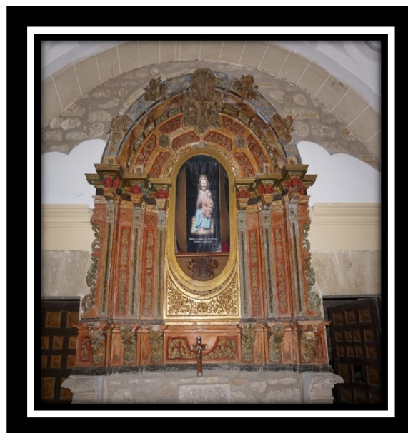
Imagen de la Virgen del Tironcillo (Siglo XIII)

El retablo de la ermita se encuentra en avanzado estado de deterioro. De no realizar una reparación urgente, corre peligro de rotura y descomposición.